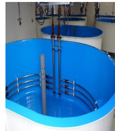
アルミハイフィン管 展示品 及びご使用例